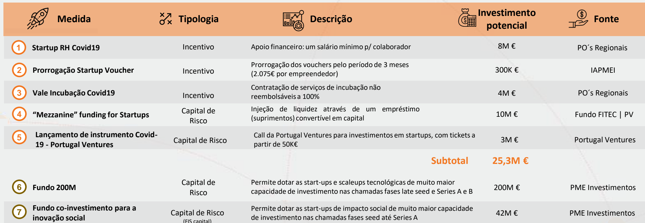
Tabela Resumo de Medidas de Apoio