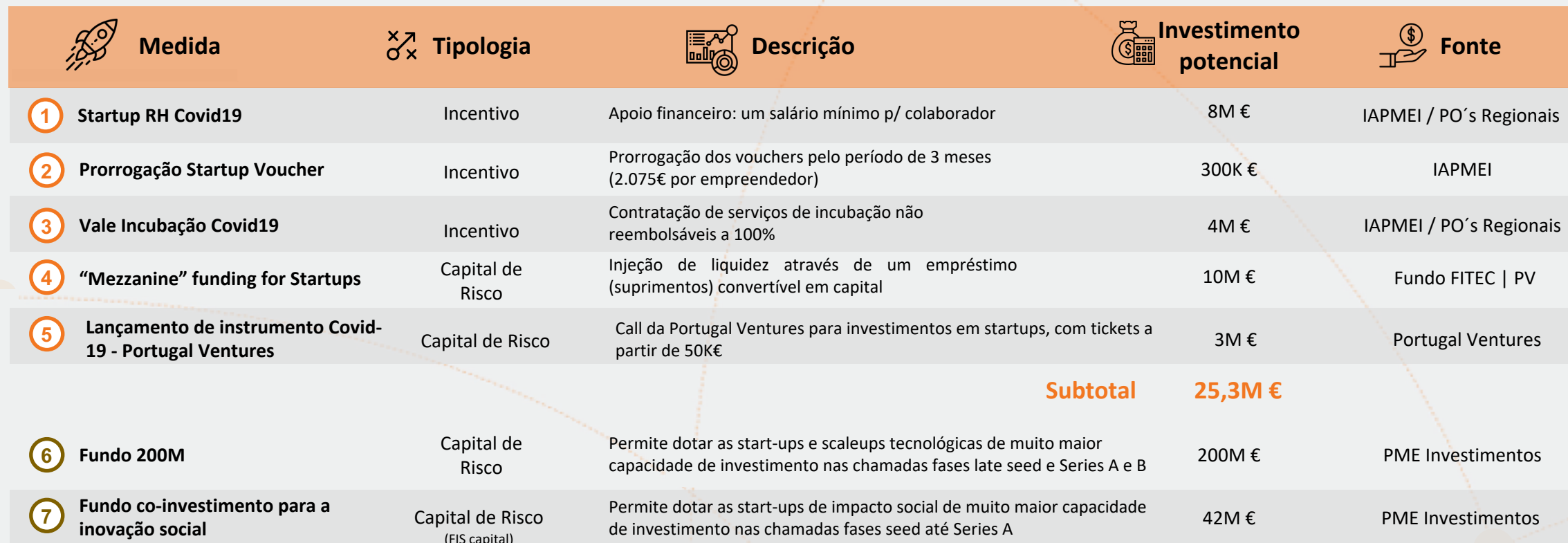
Tabela Resumo de Medidas de Apoio